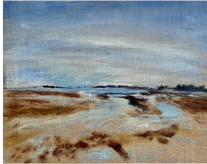
SYLT - BLICK ÜBERS WATT, 2020 MISCHTECHNIK AUF MALPLATTE, 24*30 CM