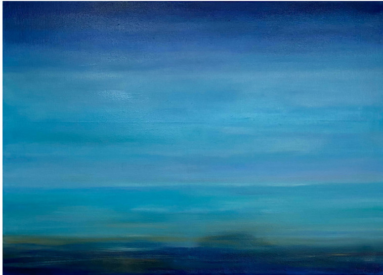
DRIVIN´BY, 2017 ÖL AUF LEINWAND, 50*70 CM