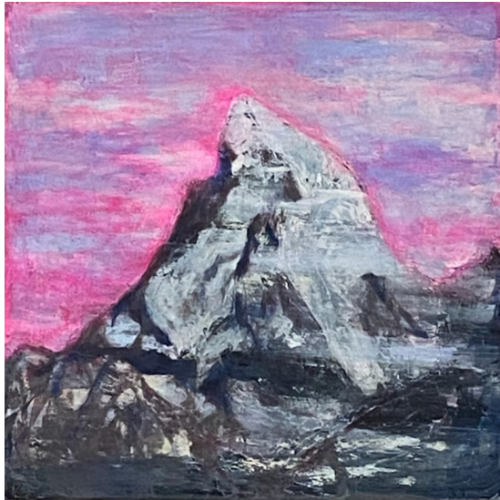
MATTERHORN, 2014 ACRYL AUF LEINWAND, 40*40 CM