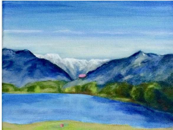
LENCHEN, 2019 ÖL AUF LEINWAND, 24*30 CM