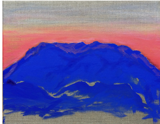
WILDE KAISERIN, 2018 MISCHTECHNIK AUF LEINWAND, 24*30 CM