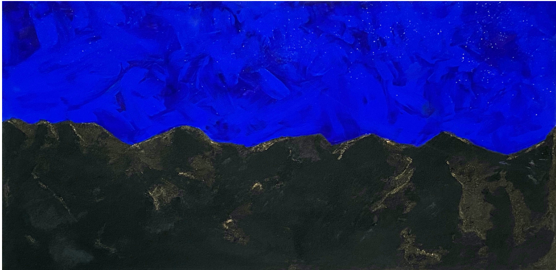
NIGHT ON EARTH, 2015 MISCHTECHNIK AUF LEINWAND 50*100 CM