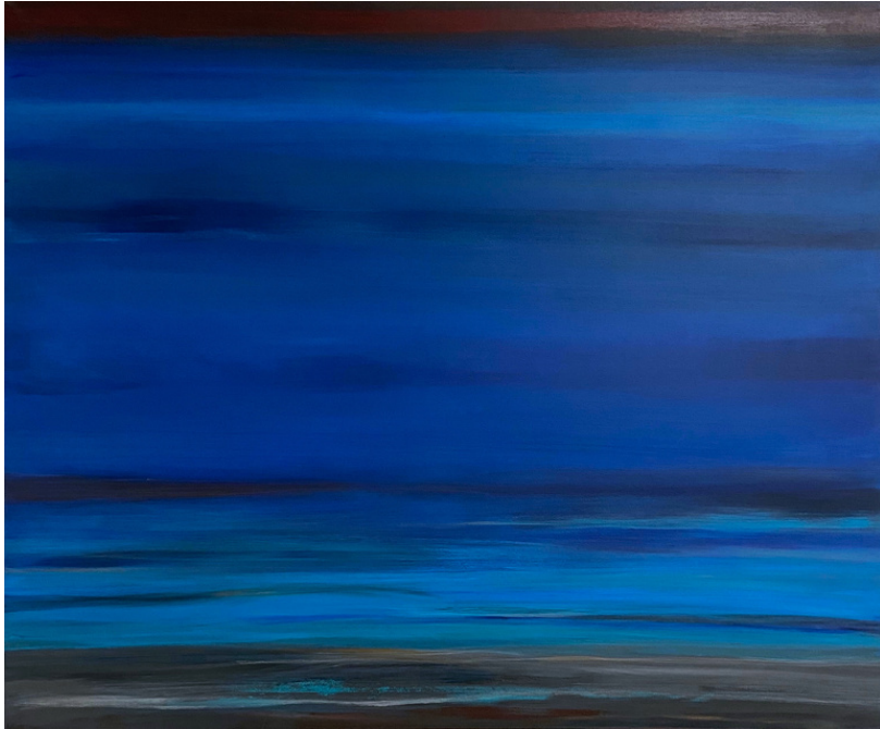
PIETRO, 2017 ACRYL AUF LEINWAND, 100*120 CM