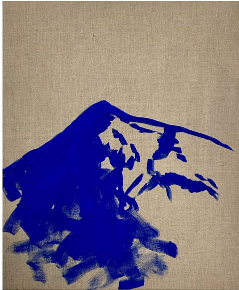
ALPSPITZE, 2017 ACRYL AUF LEINWAND, 55*45 CM