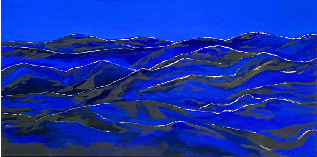
SINAI, 2015 MISCHTECHNIK AUF LEINWAND 50*100 CM