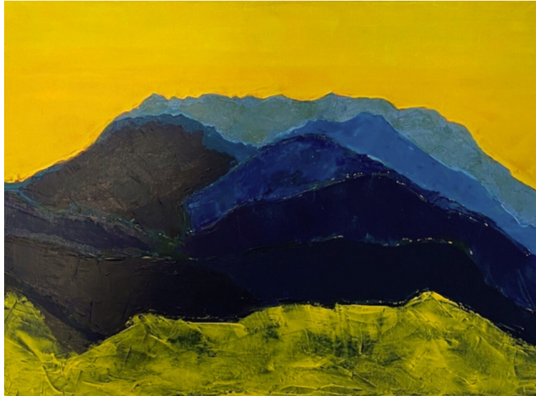
WILDER KAISER, 2012 ACRYL AUF LEINWAND, 50*70 CM