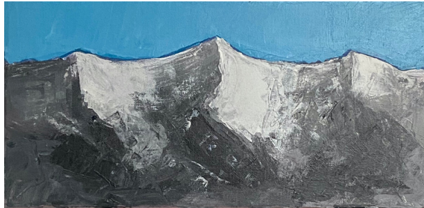
DRÜ, 2011 ACRYL AUF LEINWAND, 20*40 CM