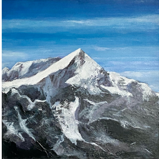
ALPSPITZE, 2011 ACRYL AUF LEINWAND, 40*40 CM