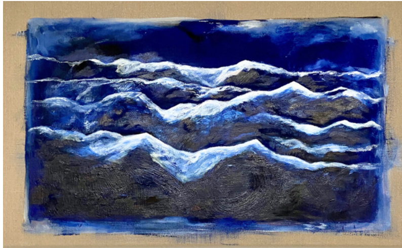
FULL MOON, 2019 MISCHTECHNIK AUF LEINWAND 44*73 CM