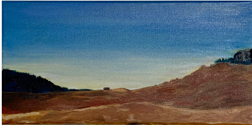
VON OBERAMMERGAU NACH UNTERAMMERGAU, 2014 ÖL AUF LEINWAND, 20*40 CM