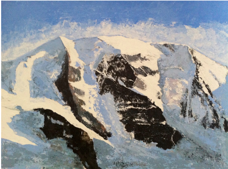
PIZ PALÜ, 2011 ACRYL AUF LEINWAND 50*70 CM