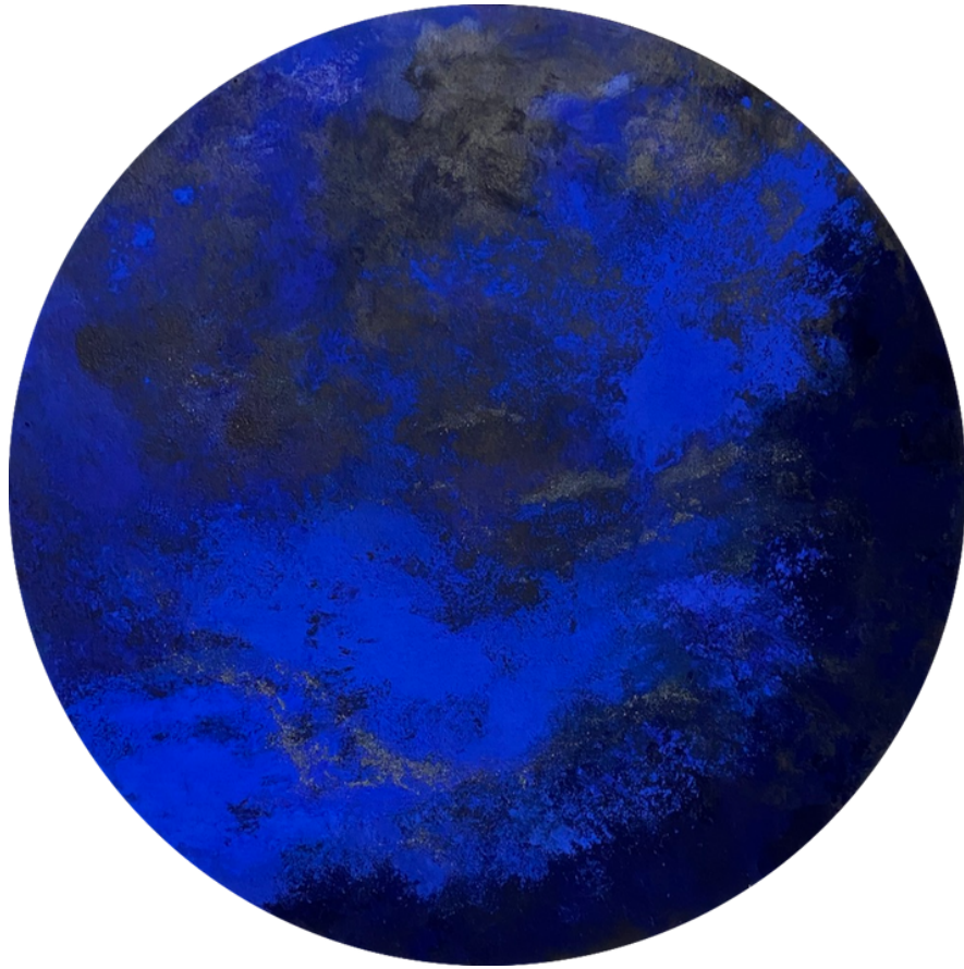
Dark Blue Sand, 2023 Mischtechnik auf Leinwand, ø 60 cm