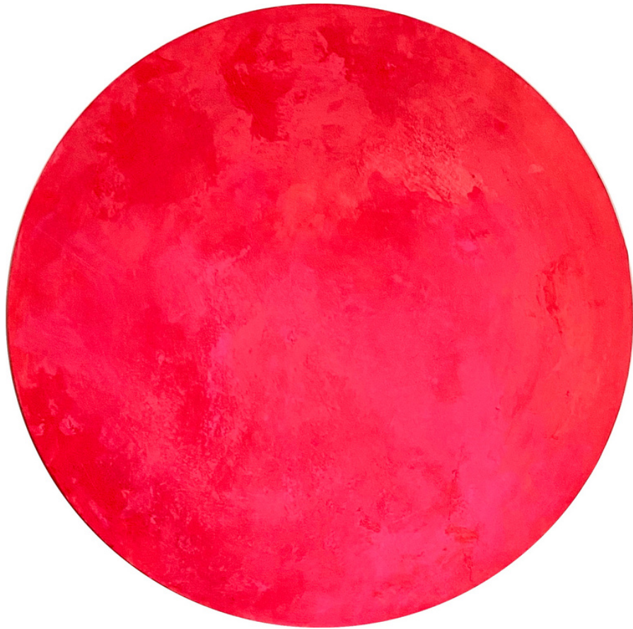
Pink Planet II, 2022 Mischtechnik auf Leinwand, ø 60 cm