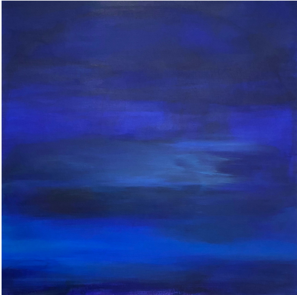
Open Sky, 2020 Acryl auf Leinwand, 80*80 cm