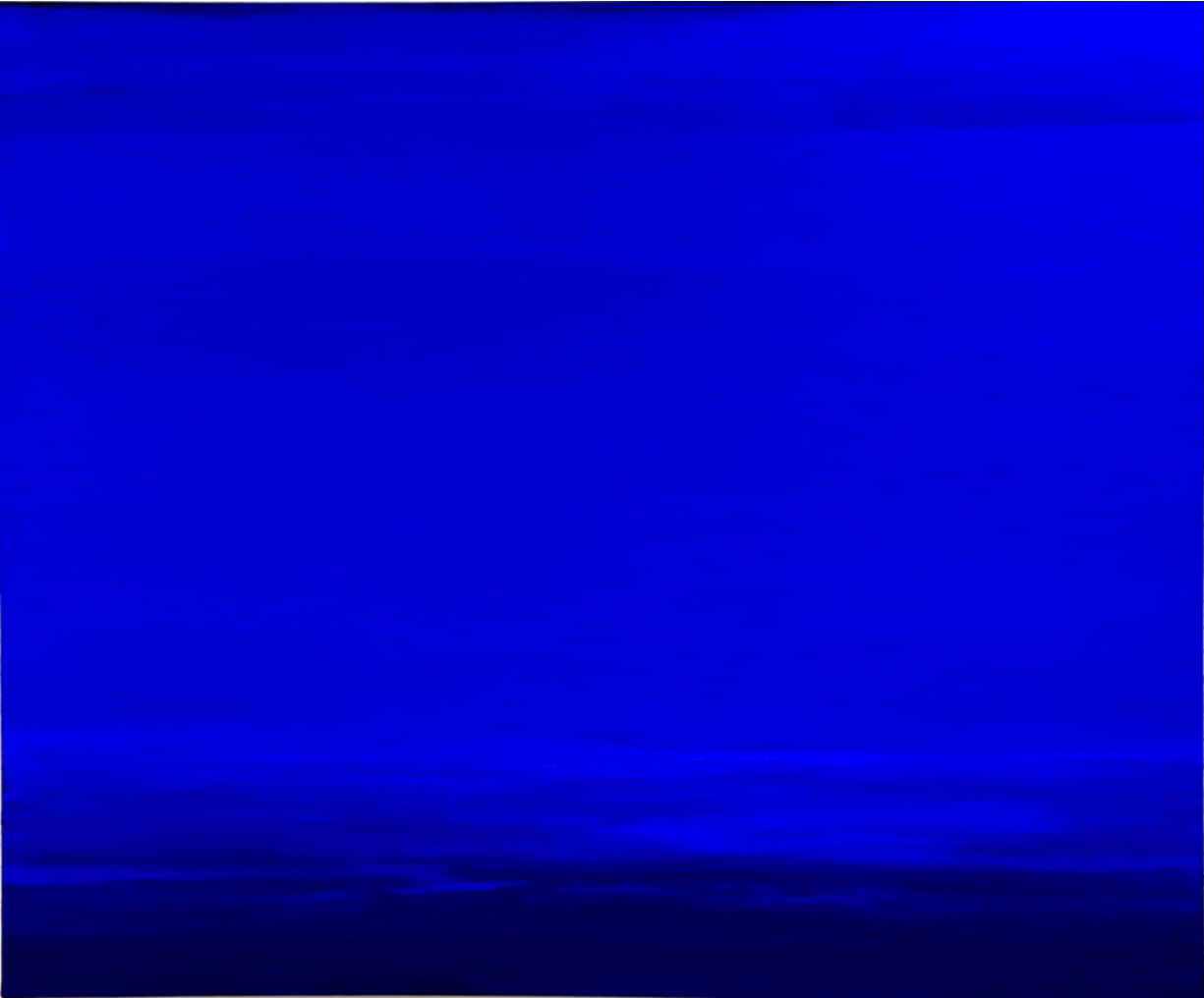
Blue Deep, 2020 Mischtechnik auf Leinwand, 100*120 cm