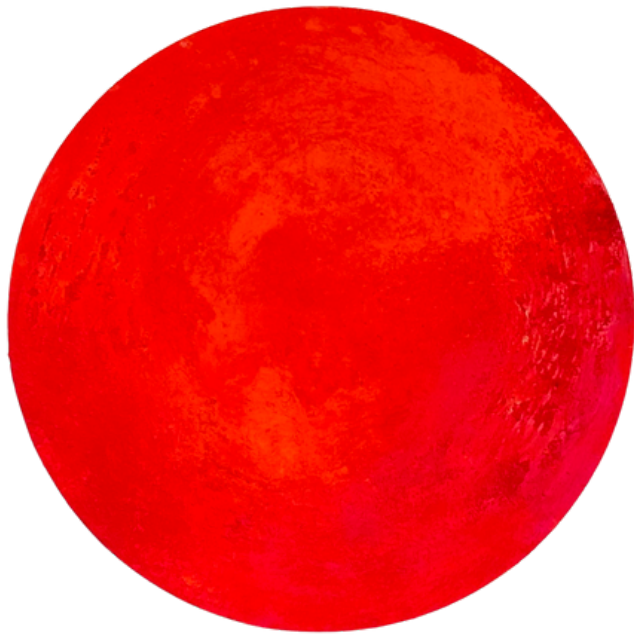
Orange Flame 2023 Mischtechnik ø 40 cm