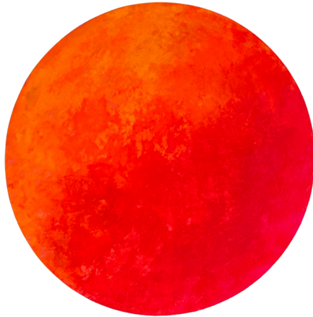
Shiny Orange, 2023 Mischtechnik auf Leinwand, ø 40 cm