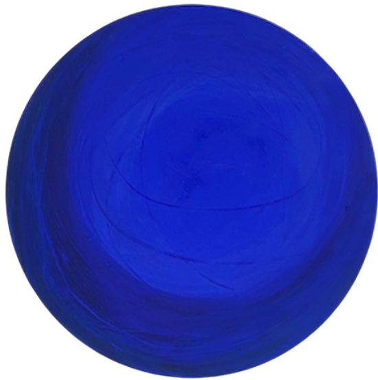
Spheric Blue 2022 Mischtechnik auf Leinwand ø 40 cm