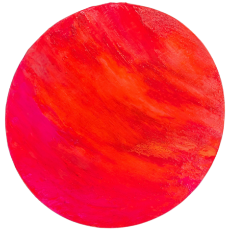
Mini-Venus, 2023 Mischtechnik ø 30 cm