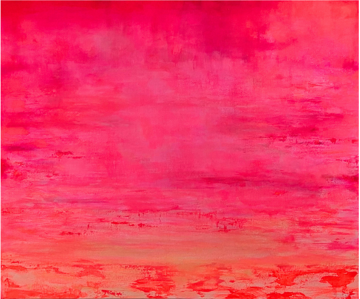
Comtesa, 2022 Acryl auf Leinwand, 100*120 cm